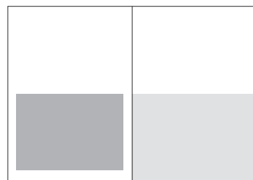
1/2 Seite quer