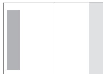
1/3 Seite hoch